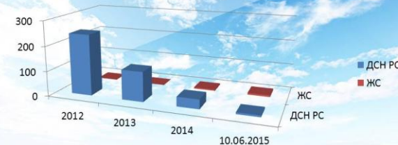
Сведения об обеспечении жильем военнослужащих